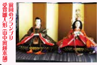
前回のグランプリ受賞雛人形(中倉餅本舗)

参加方法 ・各参加店に掲示しております投票専用QRコードを読み取り投票ください。 ※今回よりQRコードのみの投票受付となります。 ※参加店ごとにQRコードは異なっております。1店舗1投票のみ有効とさせていただきますが、複数店舗への投票は可能となっておりますので、是非、多くの店舗の雛人形・天神様をご覧ください投票ください。