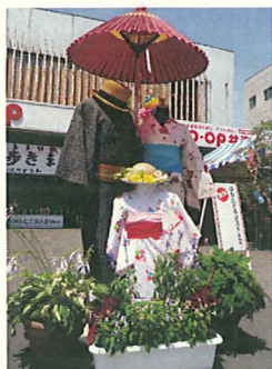
ゆかた・帯・下駄の持ち込みによる着付け大歓迎だよ!

ゆかたの無料レンタル&着付け、ヘアアレンジサービスが大人気! 喜多方レトロ横丁の雰囲気存分に堪能するにはやはり浴衣姿で会場を歩いてみることに。下駄の「ガラッゴロン」という音が心地良く、まさに縁日になったり!より一層イベントを楽しむことができる。 プロの着付けと美容師によるゆかたの無料レンタル、着付け、ヘアアレンジサービスは好評で毎年楽しみにしているファンも多い。 夏は風流に浴衣姿で出かけてみるのもいい。 浴衣を着ている方に限り、カメラマンによる記念撮影もあるよ!