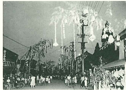
～昭和中期年代の商店街七夕飾りの様子～