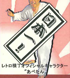
レトロ横丁オフィシャルキャラクター「あべたん」