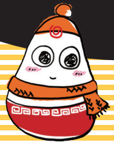
冬まつりイメージキャラクター 雪コボちゃん