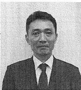
東京海上日動リスクコンサルティング株式会社 経営企画部 主席研究員