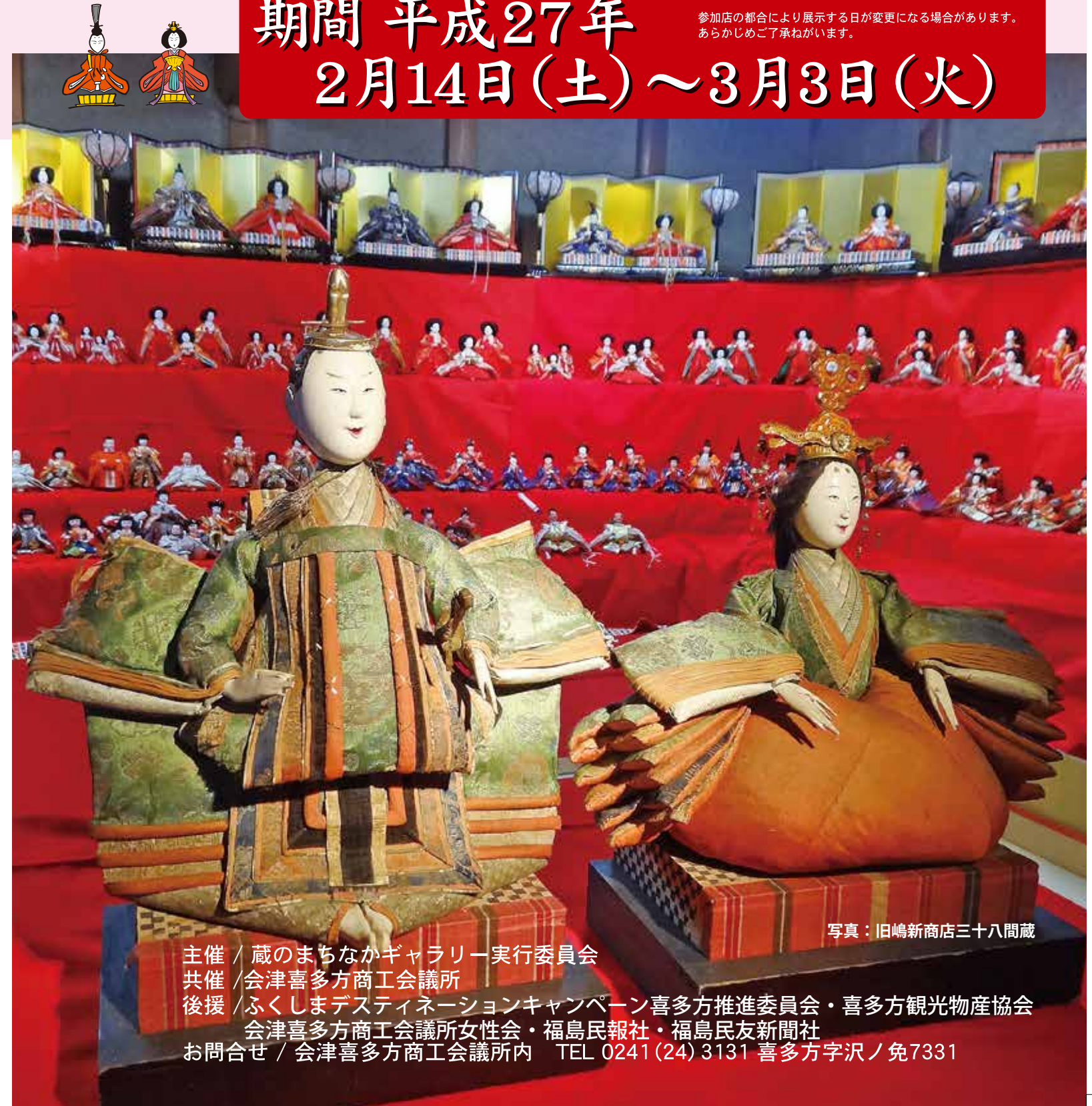
写真：旧嶋新商店三十八間蔵

参加店の都合により展示する日が変更になる場合があります。あらかじめご了承ください。