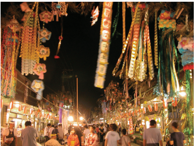
幻想的な雰囲気を出し出す夜のレトロ横丁

東日本大震災復興応援イベント ～喜多方から元気発信～ 喜多方の夏…いよいよ明日から開幕