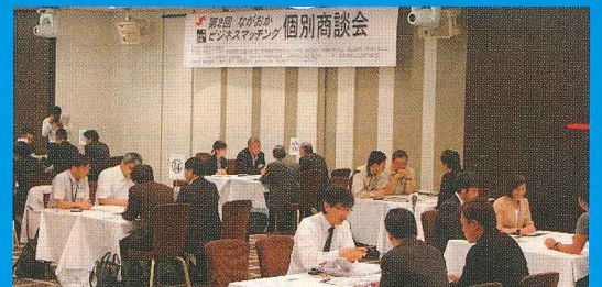
<商談イメージ(第2回の様子)>

【主催】長岡商工会議所、柏崎商工会議所、小千谷商工会議所、十日町商工会議所 【共催】長岡市、柏崎市、小千谷市、十日町市、(一社)新潟県商工会議所連合会、新潟県商工会連合会、(一社)群馬県商工会議所連合会、(一社)埼玉県商工会議所連合会、富山県商工会議所連合会、(一社)長野県商工会議所連合会、福島県商工会議所連合会、山形県商工会議所連合会 【後援】(株)北越銀行、(株)大光銀行、(株)第四銀行、(株)りそな銀行、長岡信用金庫、柏崎信用金庫、長岡ものづくりネットワーク